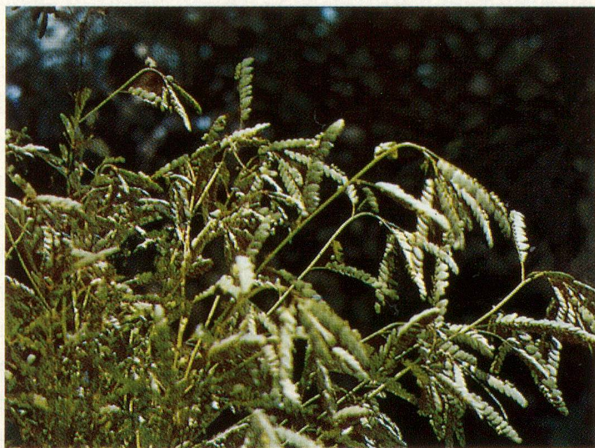
Indianerkräutlein gegen Nierensteine: Chanca Piedra.

(*Anmerk. der Red.: Im peruanischen Tarapoto kaufte Alfred Vogel 1958 eine Farm. Planta Muña und Rocoto sind u. W. in Europa nicht, Chanca piedra ist via A. Vogel GmbH, CH Teufen, Tel. 071/333 10 23, erhältlich).