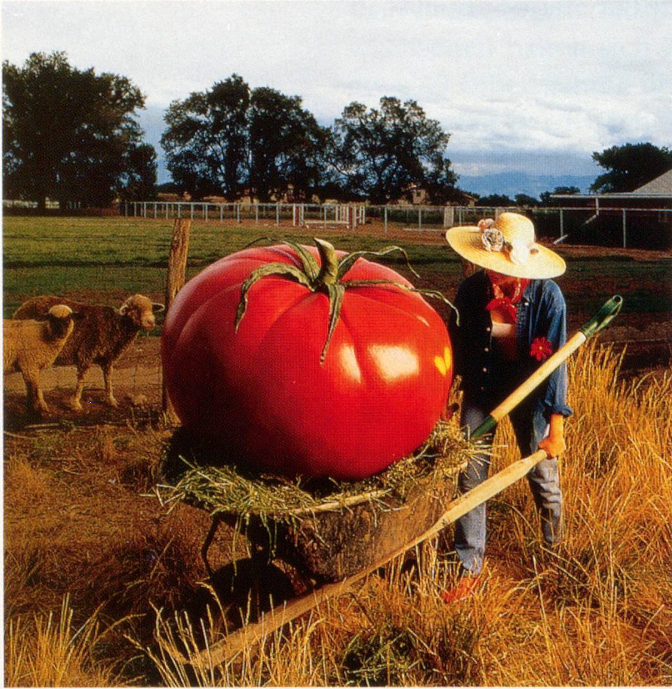
Holland, Spanien und Marokko sind die Hauptimporteure von Tomaten in die Schweiz.