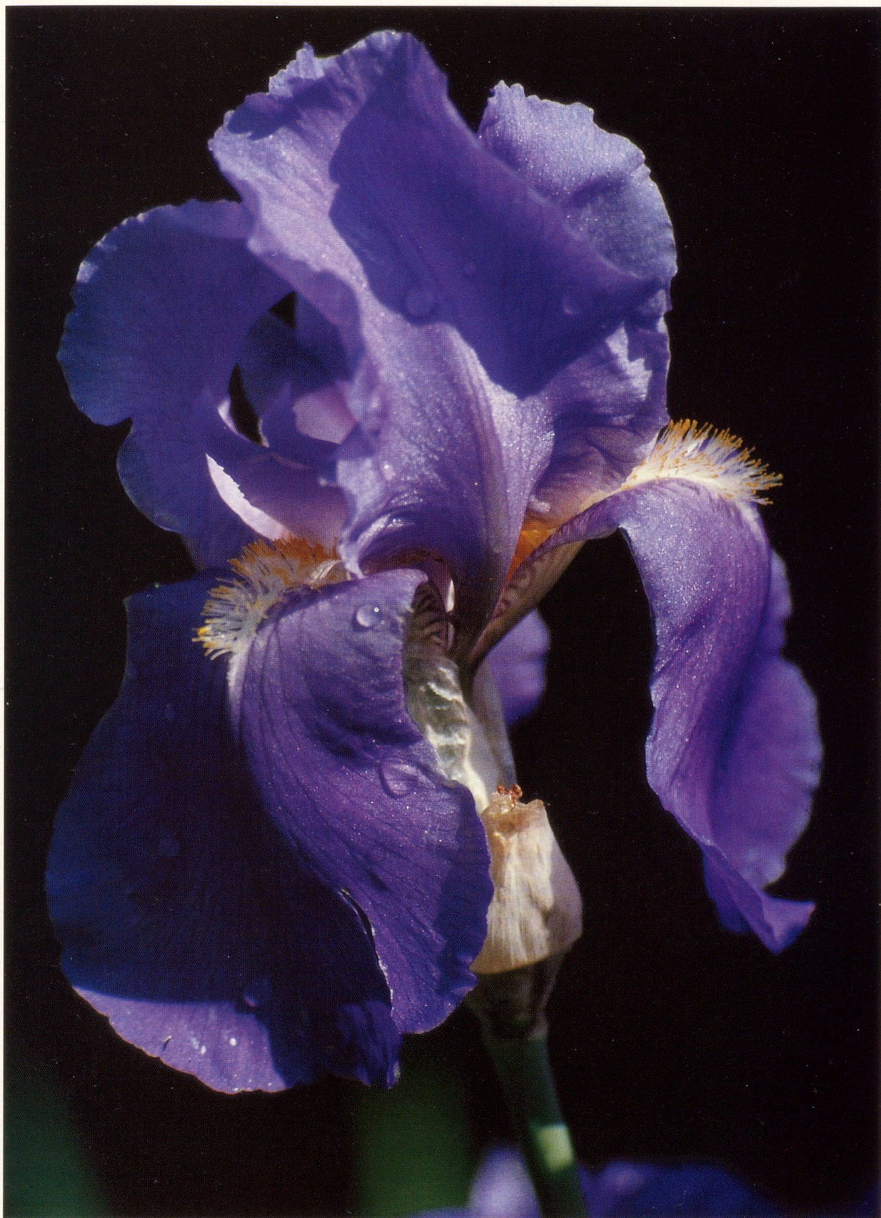
Iris / Schwertlilie