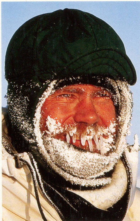
Wer hat wohl Lust, ihn aufzutauen?