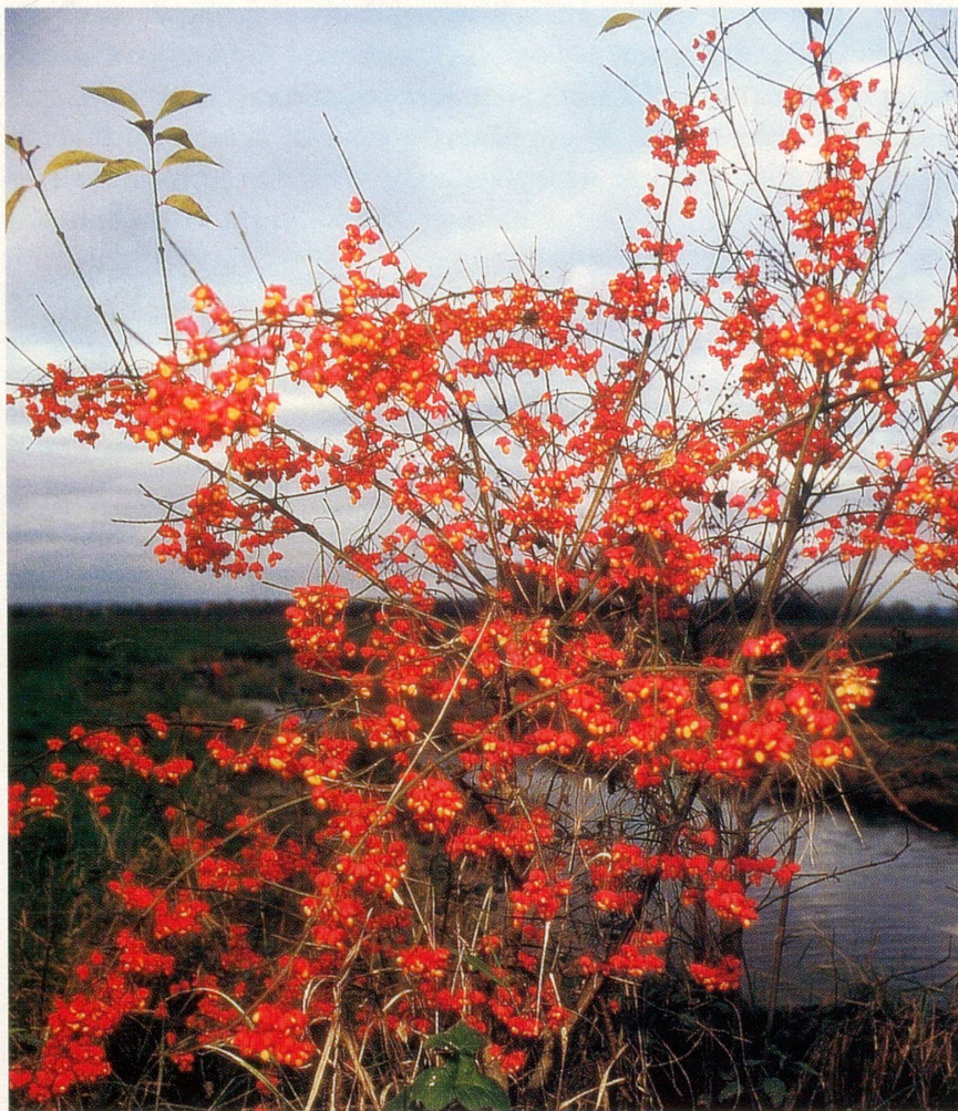
DIE LESERFORUM-GALERIE Alfred Pfister: Pfaffenbütchen

Frau T. R. aus Unterseen schreibt: «Ich litt auch jahrelang genau an diesem Problem und habe nun grossen Erfolg mit der Anwendung von High Potency Vitamin E Oil von Aura-Soma . Auch meide ich jede Art von Weisschimmelkäse! Seit ca. drei Monaten wende ich eine andere spezielle Gesichtscreme an, und seither habe ich eine noch schönere Haut und absolut keine Rötungen und Schuppen mehr. Die Creme ist sehr teuer (ich leiste mir diesen Luxus), und ich bezweifle, dass sie von der Krankenkasse bezahlt wird. Das amerikanische Produkt heisst La Mer oder Creme de la Mer , ich beziehe sie aus der Parfumerie. Noch ein Tipp: Lassen Sie sich