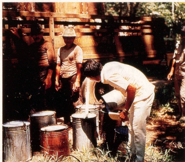
Die gesammelte «Ernte» jedes Kautschukzapfers wird von einem Vorarbeiter gemessen.

Erst im Jahre 1734 durchquerte im Rahmen einer Expedition, ein französischer Forscher namens Charles Marie de la Condamine die Anden, um im Auftrag der französischen Akademie Vermessungen der Erdoberfläche anzustellen. Der Forscher interessierte sich auch für die fremde Pflanzenwelt und entdeckte ne-