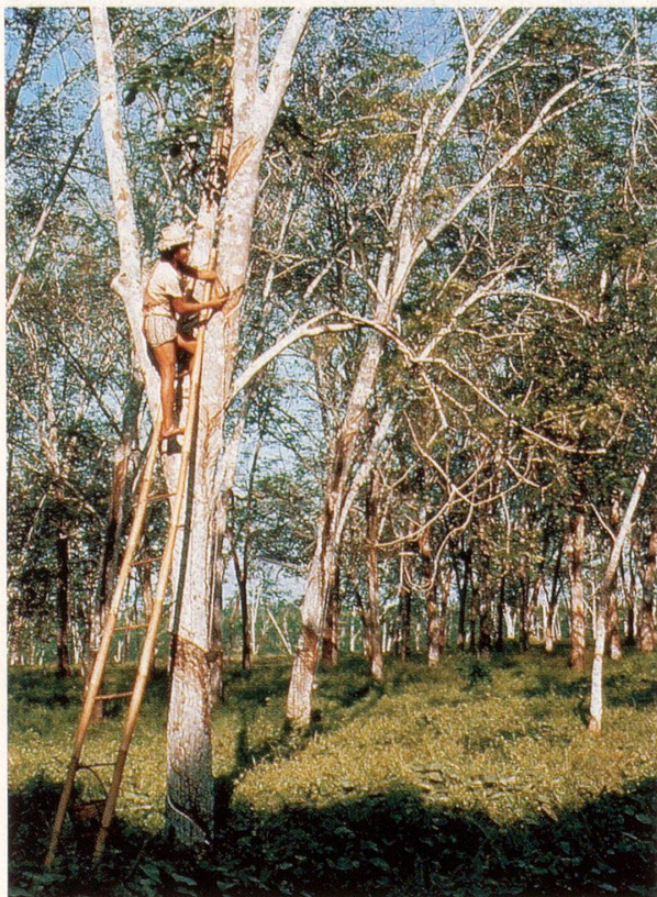
Der weltweit wichtigste Lieferant von Naturkautschuk ist der Parakautschukbaum aus Brasilien.

Ob Kinderball oder Hundespielzeug, Förderband oder Autoreifen, Taucheranzug oder Feuerwehrschauch, Bodenbelag oder Babywindel, Infusionsschlauch oder Industriekabel – keines dieser Produkte kommt ohne Kautschuk aus. Selbst in der Mode und bei der Schmuckherstellung wird das elastische Material benutzt. In der Seilbahn schützt es uns vor Zugluft, und es dämpft, wenn nicht die Wut des Türenknallers, so doch dessen Lautstärke.