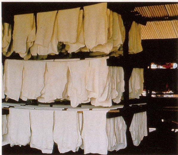
Das geronnene Latex wird gewaschen, gepresst und in Räucheröfen getrocknet.

Schon bei einem 1783 zum Einsatz gebrachten Heissluftballon, der auf rund 3000 Meter Höhe stieg, bestand die Hülle aus Seide, die mit einer Kautschuklösung abgedichtet war. Und obwohl bereits 1791 ein Patent zur Herstellung gummierter Gewebe erteilt worden war, fand Kautschuk erstmals grössere praktische Verwendung ab 1823, als der Engländer Charles Macintosh ein wesentlich billigeres Lösungsmittel (Naphta statt Terpentin) entdeckte. Damit nahm die Fabrikation wasser- und luftundurchlässiger Stoffe einen gewissen Umfang an. Die Gummi-Industrie wuchs vor allem in England tüchtig an, nicht zuletzt deshalb, weil im dortigen, typisch milden und feuchten Klima die schlechten Eigenschaften des Kautschuk weniger zur Geltung kamen. Doch in Ländern, in denen die Temperaturen heftigeren Schwankungen unterlagen, gab es viele Probleme mit dem stinkenden, klebrigen und brüchigen Gummi.