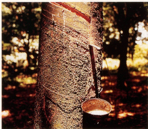
Nach fünf bis sieben Jahren ist der Baum «zapfereif». Aus der Kerbe rinnt Latex in eine Schale.

Wann und wo die Urbevölkerung Südamerikas das erste Mal Bekanntschaft mit dem Kautschukbaum schloss und anfang, seinen Milchsaft für das alltägliche Leben zu nutzen, das allerdings hält der dichte Dschungel als Geheimnis tief verborgen. Bekannt ist, dass bereits die Azteken ein «besonderes Spiel» mit