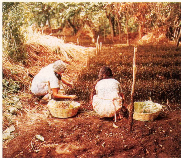
Junge Pflänzchen werden in einem beschatteten Beet angekeimt.

Der wichtigste Kautschuklieferant ist der Parakautschukbaum ( Hevea Brasiliensis ), der bis zu 20 Meter hoch wird, zu den Wolfsmilchgewächsen zählt und ursprünglich aus dem tropischen Regenwald Südamerikas kommt.