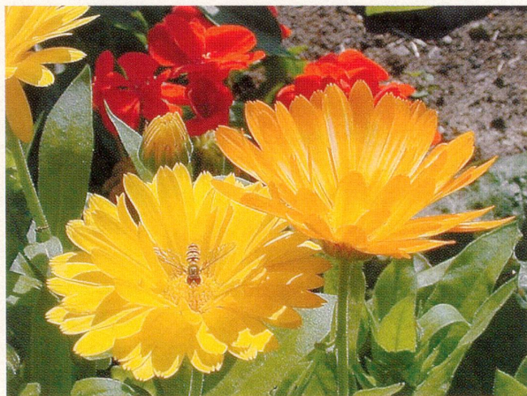
Reizvolles Detail aus dem A. Vogel-Schaugarten

Oberhalb des als Biedermeierdorf bekannten Kurortes Heiden im Appenzeller Vorderland liegt das traditionsreiche Mineralbad Unterrechstein, das nach seiner Neugründung im September 1982 nun mit Stolz sein 20-jähriges Jubiläum begeht. Neben dem qualitativ hervorragenden Heilwasser im Schwimmbad und an der Trinksäule verfügt die Anlage über zahlreiche weitere Attraktionen im Wellness- und Fitnessbereich, deren hohe Qualität das Gütesiegel «Q» von Schweiz Tourismus belegt. Neben Freiluft-Sonnenterrasse, Solarium, Sauna, Finarium und Fusspflegestudio ist das vielseitige Kursangebot mit Bodyforming, Gymnastik, Aquafit, Walking, Joggen und natürlich Schwimmen ein häufig und gern genutzter Anziehungspunkt für die Besucher, wobei sich Spinning (ein intensives Ausdauer- und Kreislauftraining auf speziellen Indoor-Bikes zu fetziger Musik) als eigentlicher Renner erwies. Bei den Besuchern sehr beliebt sind auch der von Heiden nach Unterrechstein (und weiter bis nach St. Anton) führende Gesundheitsweg, der altbewährte Heilverfahren aufzeigt, sowie der 1994 angelegte Alfred-Vogel-Heilpflanzengarten. Die Zukunftspläne des Mineralbads