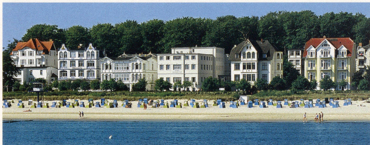
Prächtige Villen an der Strandpromenade prägen das Gesicht der Seeheilbäder auf der Insel.

Was ist denn so neu an dieser Bewegungstherapie? Gar nichts, wir wissen es doch längst, dass regelmässiges, zügiges Wandern und rhythmische, körperliche Bewegung gesundheitsfördernd sind. Die allgemeine Zirkulation wird angeregt, das Beinmuskel-Training för-