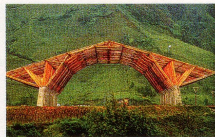
Bambuspavillon an der Expo 2004. Lagerhalle in Pennsylvania/USA (unten).