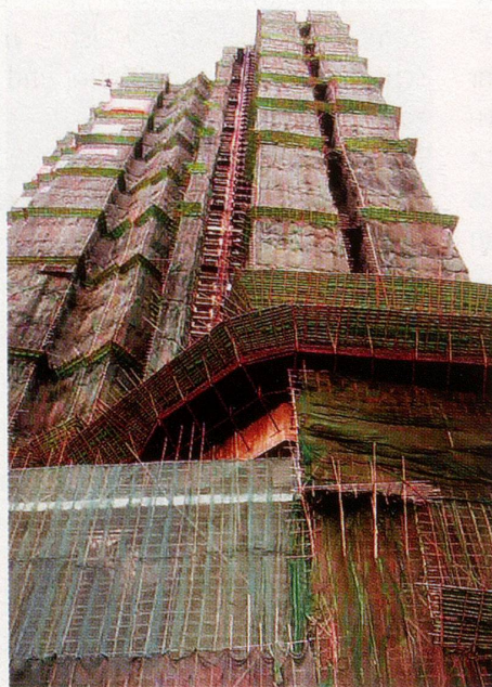
Im Hochbau auch heute noch unverzichtbar: Bambusgerüste.