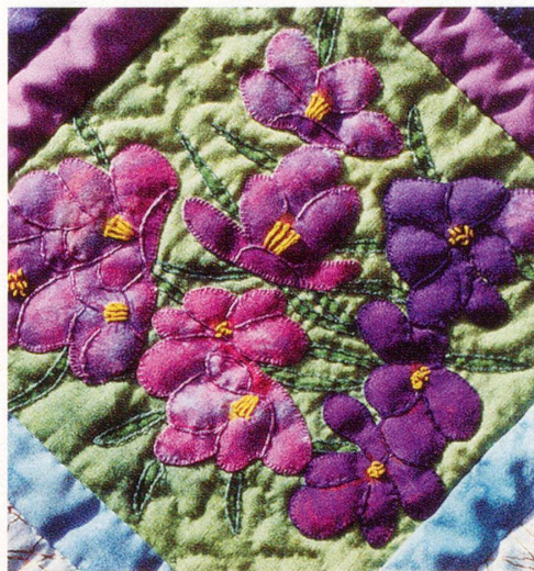
Motive aus dem «GN-Blumen-Quilt».