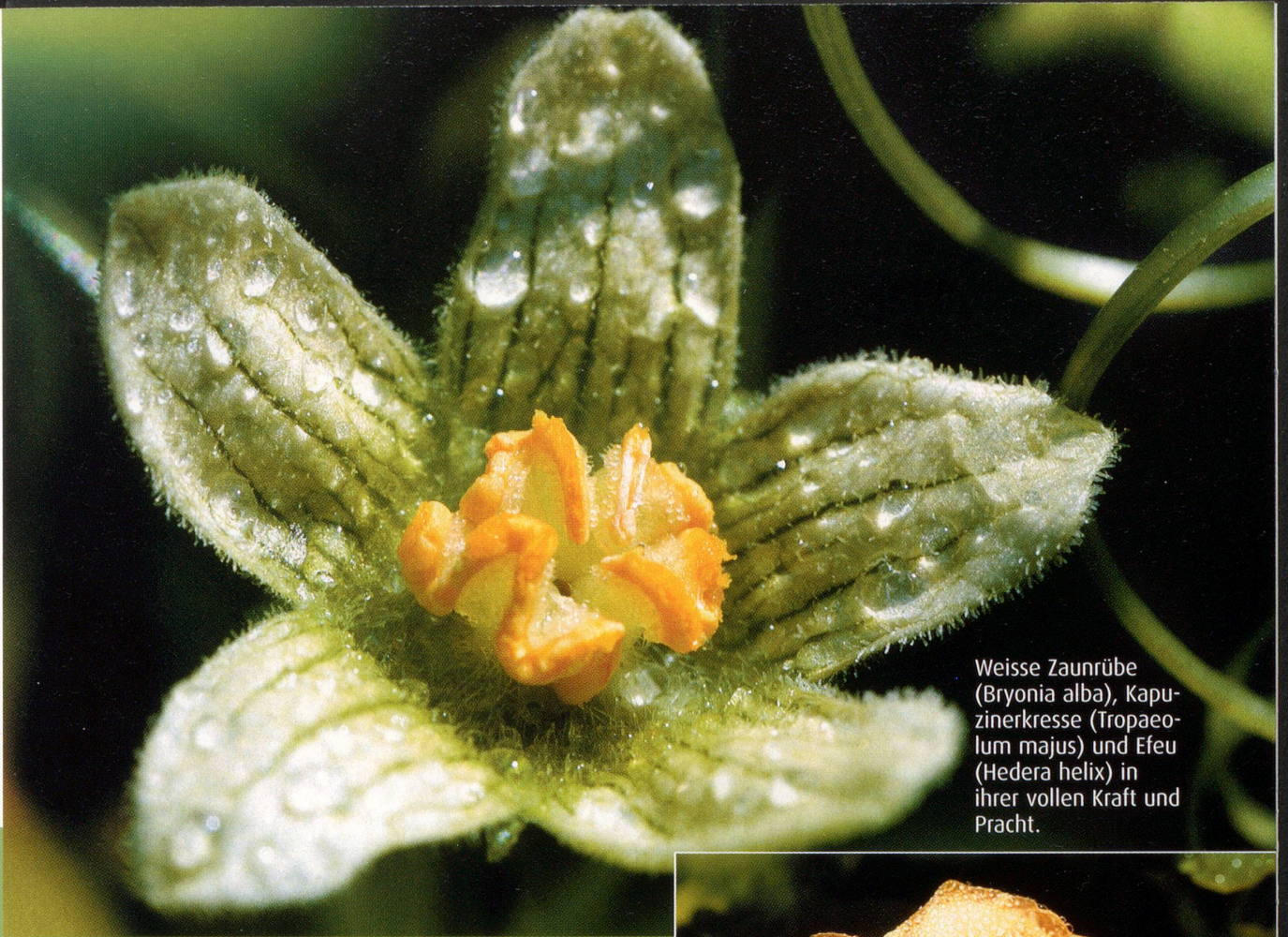
Weisse Zaunrube (Bryonia alba), Kapuzinerkresse (Tropaeolum majus) und Efeu (Hedera helix) in ihrer vollen Kraft und Pracht.