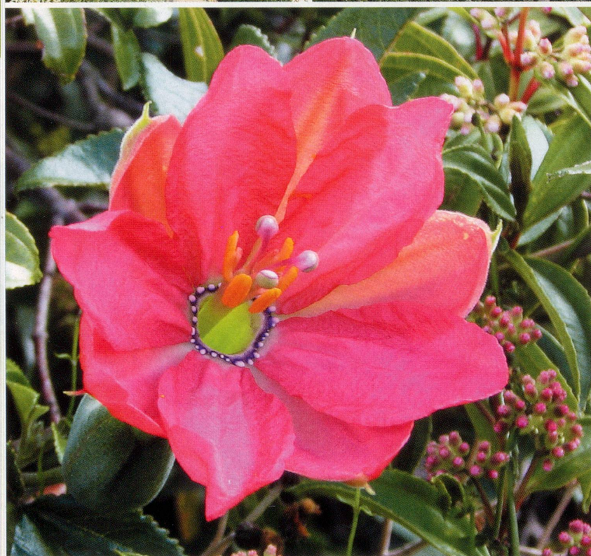
Die vielfältige Landschaft Perus (oben das Colca-Tal nördlich von Arequipa) ist Heimat Hunderter von Heilpflanzen. Prächtiger Ausdruck dieser üppigen Natur ist die Cantuta ( Cantuta buxifolia , unten), die «Blume der Inkas» und Nationalblume Perus.