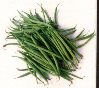
Sellerie, frische grüne Bohnen, Kohlrabi, Randen (Rote Bete) und Karotten sind basenbildende Gemüse.