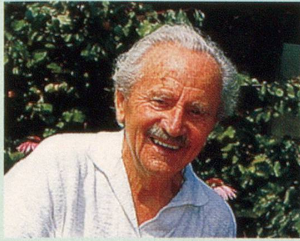
Alfred Vogel (1902 – 1996)