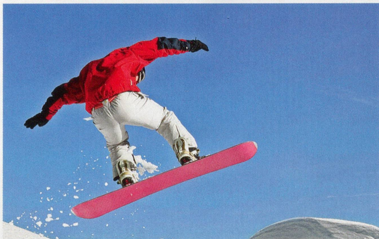
Vielfältig, spannend, international: Die Sporterlebnisse der GN-Leser.