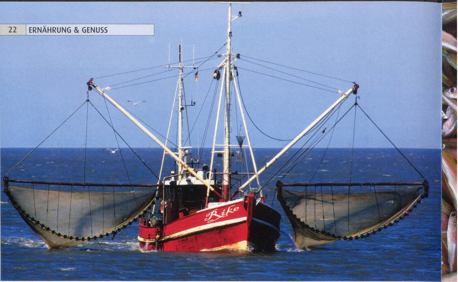
Sardinen und Sardellen (rechts) werden mit Fangmethoden gefangen, die den Meeresboden nicht beschädigen.

Über drei Viertel der weltweiten Fischbestände gelten nach neuesten Zahlen der Welternährungsorganisation FAO (Food and Agriculture Organization) als ausgebeutet und erschöpft. Das betrifft z.B. Aal, Heilbutt, Schellfisch, Scholle und Steinbutt, aber auch Crevetten. Wanderfische und die grossen Räuber des Ozeans sind in ihren Beständen deutlich dezimiert: Thun- und Schwertfisch, Hai und Marlin. Auch illegaler Fischfang wird betrieben, und viele Fischfang-Nationen haben sich an keines der Völkerrechtsabkommen zum Schutz der Meere gebunden.