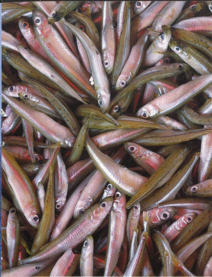
Sardellen gelten, ausser im Mittelmeer, als nicht überfischt.

tragen wie im Falle der tropischen Crevettenzucht zur Zerstörung empfindlicher Habitats wie der Mangrovenwälder bei.