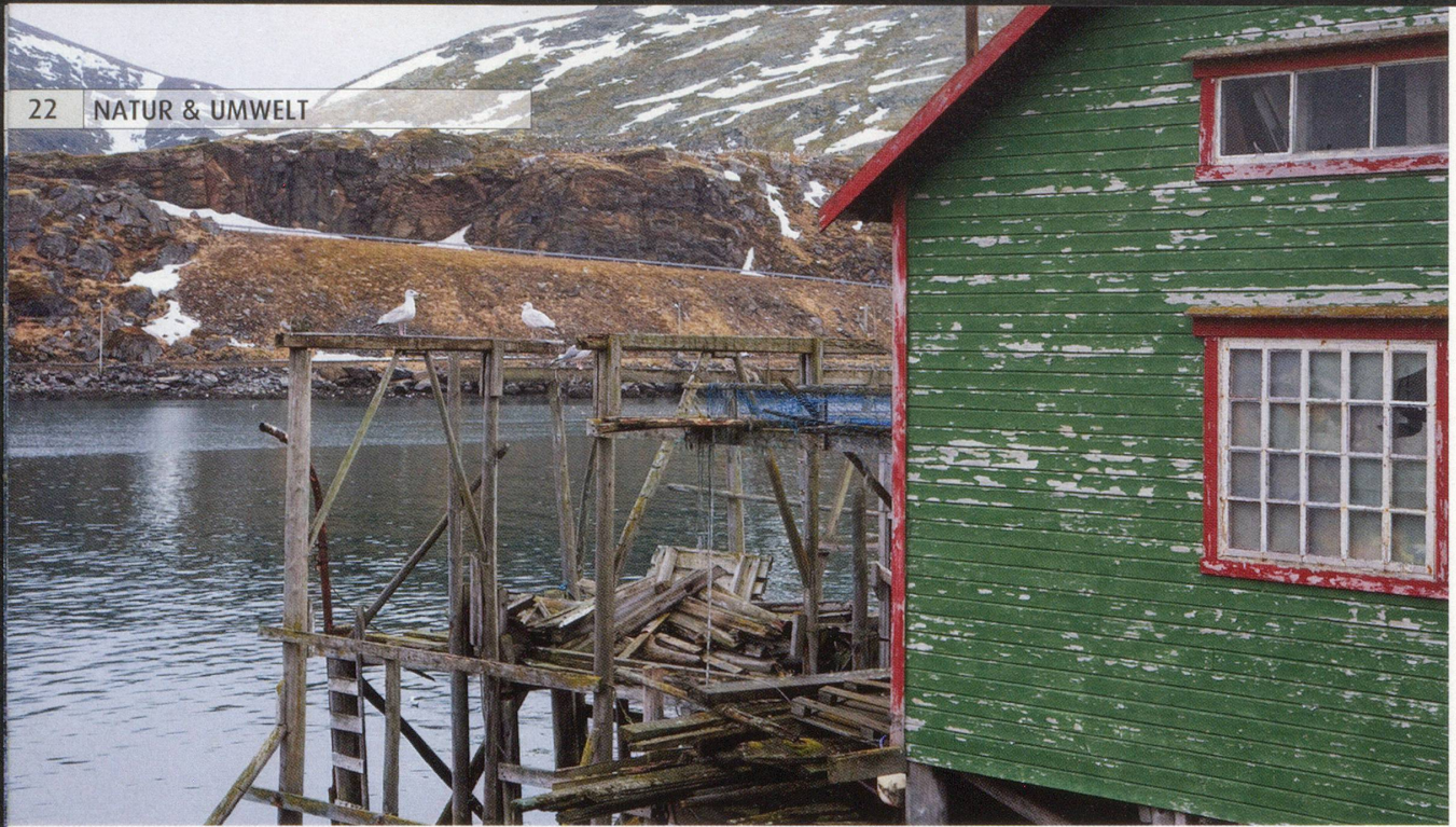
Die Fischerhäuschen-Idylle in Havøysund samt dem bei den Norwegern so beliebten Stockfisch trägt.

Die meisten Fischer weltweit werfen ihren Beifang über Bord. Das Ministerium unterhält Forschungsanstalten, die Fischwanderungen, Laichverhalten oder Bestände untersuchen. «Durch eine Quotenregelung wird der aktuelle Bestand von etwa 20 wichtigen Arten reguliert – ein natürlicher Prozess», betont der Meeresbiologe.