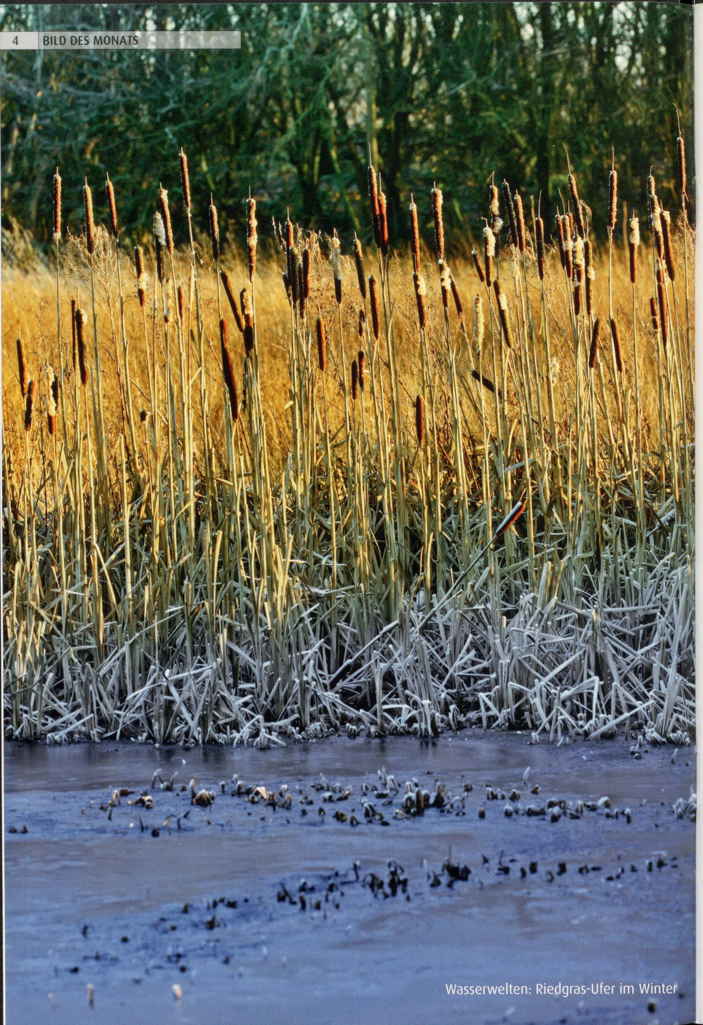
Wasserwelten: Riedgras-Ufer im Winter