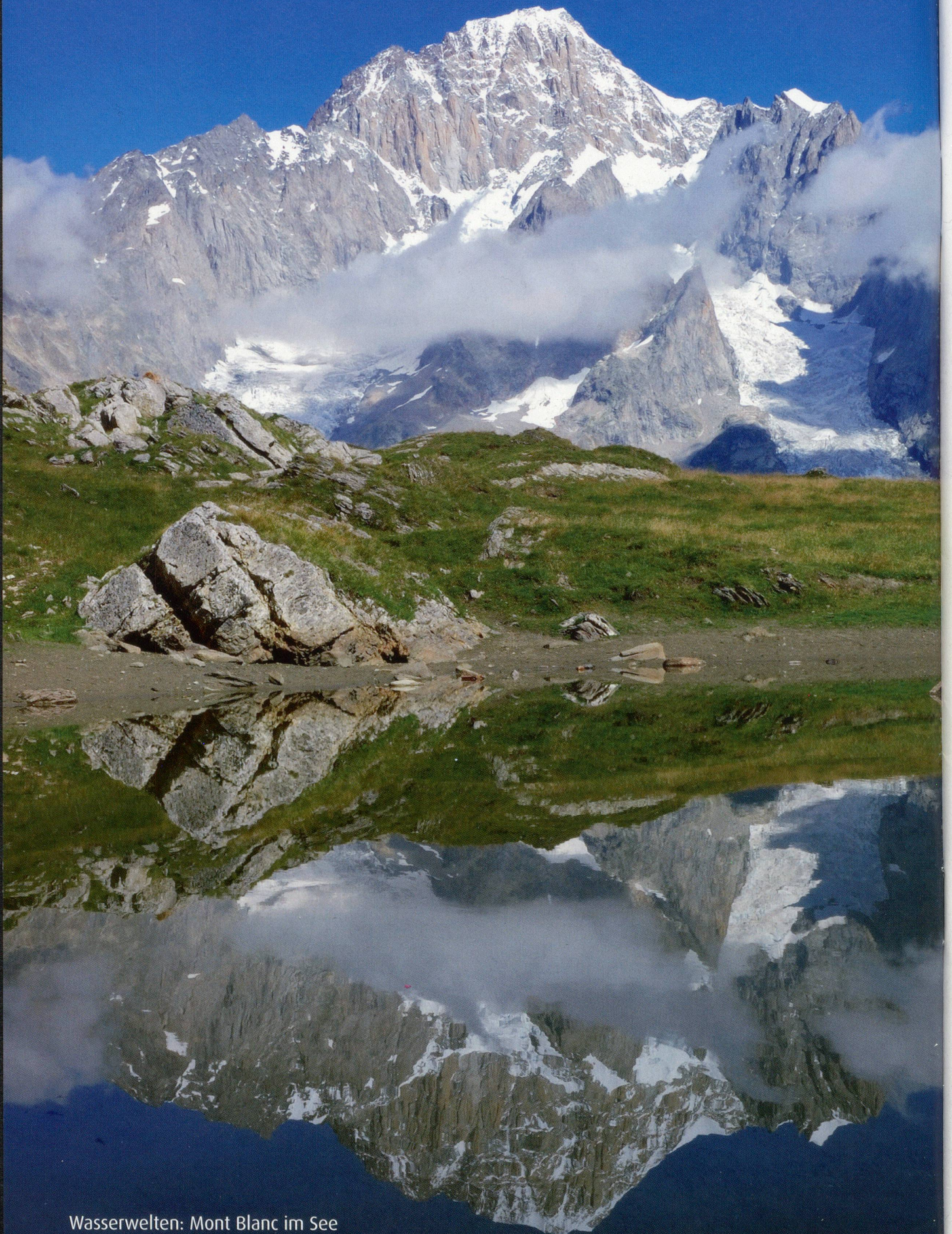
Wasserwelten: Mont Blanc im See