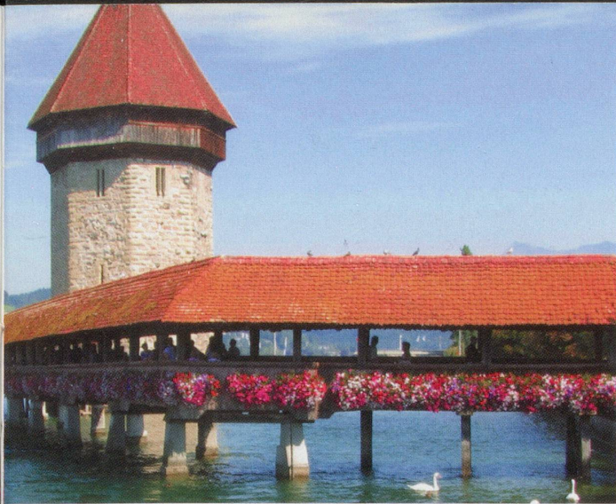
Ansicht aus einer der gesuchten Schweizer Städte.