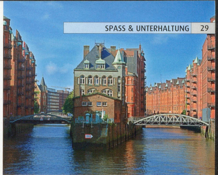
Ansicht aus einer der gesuchten deutschen Städte.