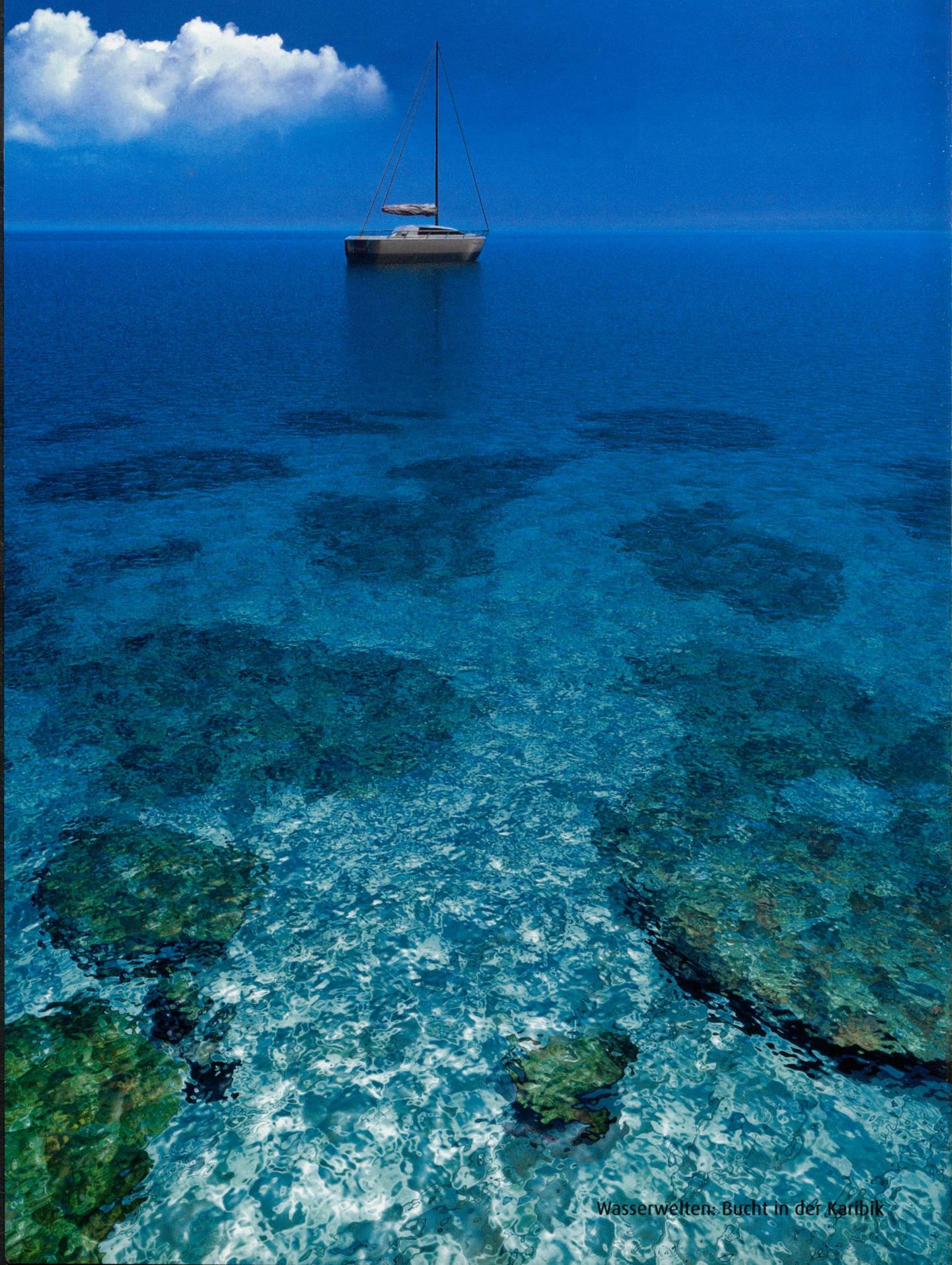
Wasserwelten: Bucht in der Karibik