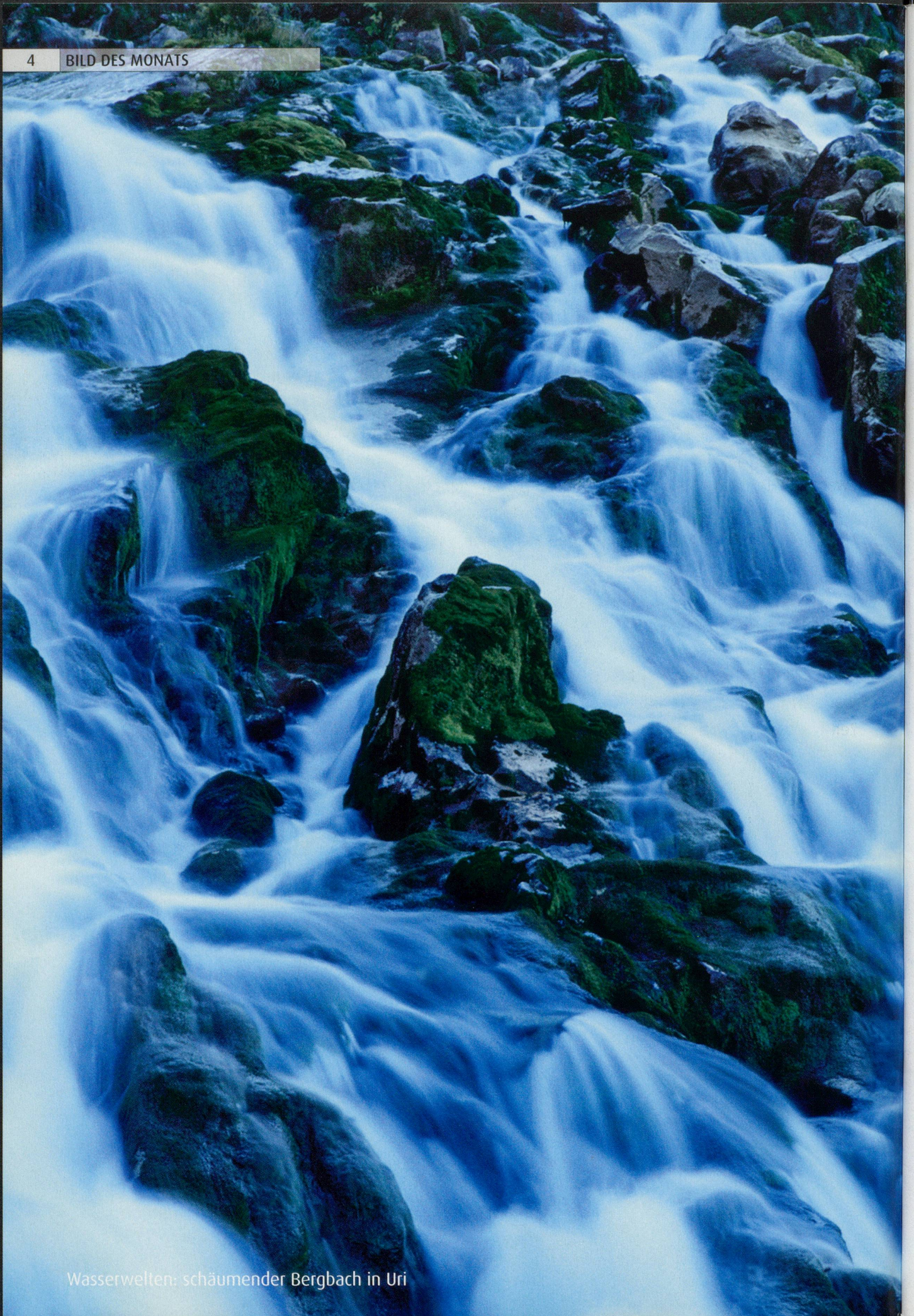
Wasserwelten: schäumender Bergbach in Uri