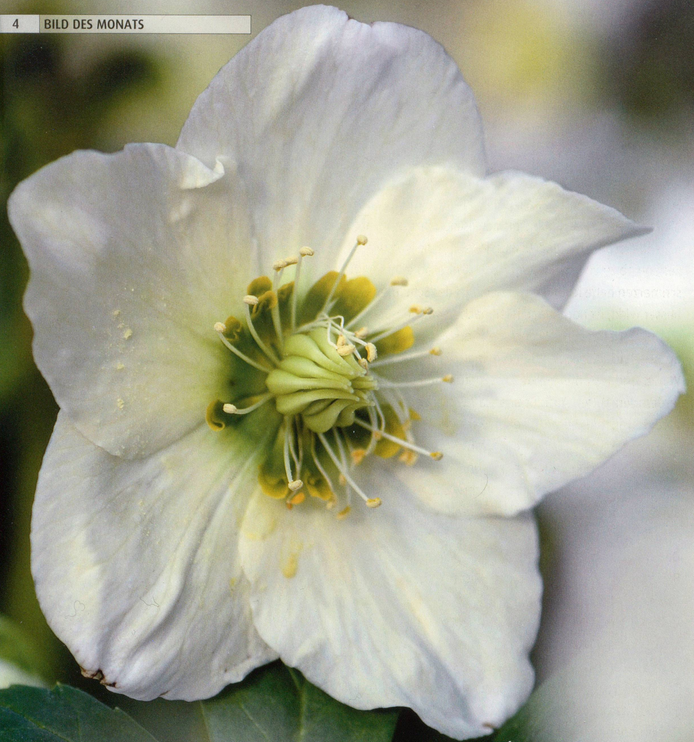
Gartenschönheit Schneerose ( Helleborus niger )