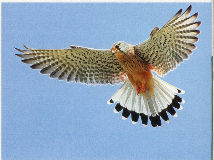
Der Turmfalke jagt in der Stadt ebenso wie im Gebirge.

Nicht nur Felsbewohner entdeckten die Städte als neuen Lebensraum. Nach ihnen siedelten sich mit der Zeit auch Vögel lichter Wälder in den Städten an. Finken- und Drosselarten fanden statt im Wald auch in den Gärten und Stadtparks zusagende Lebensbedingungen. Ein noch junger Kulturfolger ist die Amsel. Anfang des 19. Jahrhunderts war sie noch ein scheuer Waldvogel. Heute ist sie bis in die Stadtzentren vorgedrungen und lässt sich nicht einmal von den stadterfahrenen Spatzen einschüchtern.