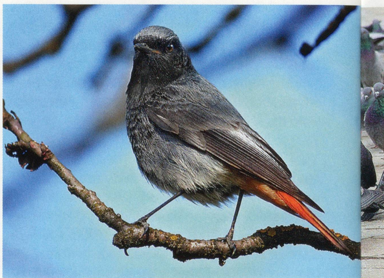
Der Hausrotschwanz war früher ein reiner Felsbewohner.

Dieses Flugschauspiel, begleitet von trillernden Rufen, sieht man heute nicht nur im Gebirge, sondern auch in Städten: im schweizerischen und im deutschen Freiburg, in Bern und Zürich, in Lörrach und Lindau. Die Alpensegler ( Apus melba ) nisten nicht nur in schroffen Felswänden und an Steilküsten, sondern auch an hohen Gebäuden und Türmen, unter Hausdächern und Brücken. Die grösste Alpenseglerkolonie von St. Gallen findet sich im Brückenkasten des Sitter-Autobahnviaduktes.