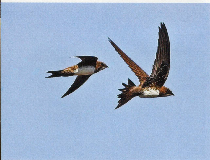
Alpensegler sind wahre Flugkünstler.

Viele unserer vertrauten Stadtvögel stammen ursprünglich aus Gebirgsregionen. Felsbewohner wie Hausrotschwanz, Felsentaube, Turmfalke oder verschiedene Schwalbenarten zogen im Mittelalter in die wachsenden Städte, wo es weniger Konkurrenz und viel Nahrung gab.