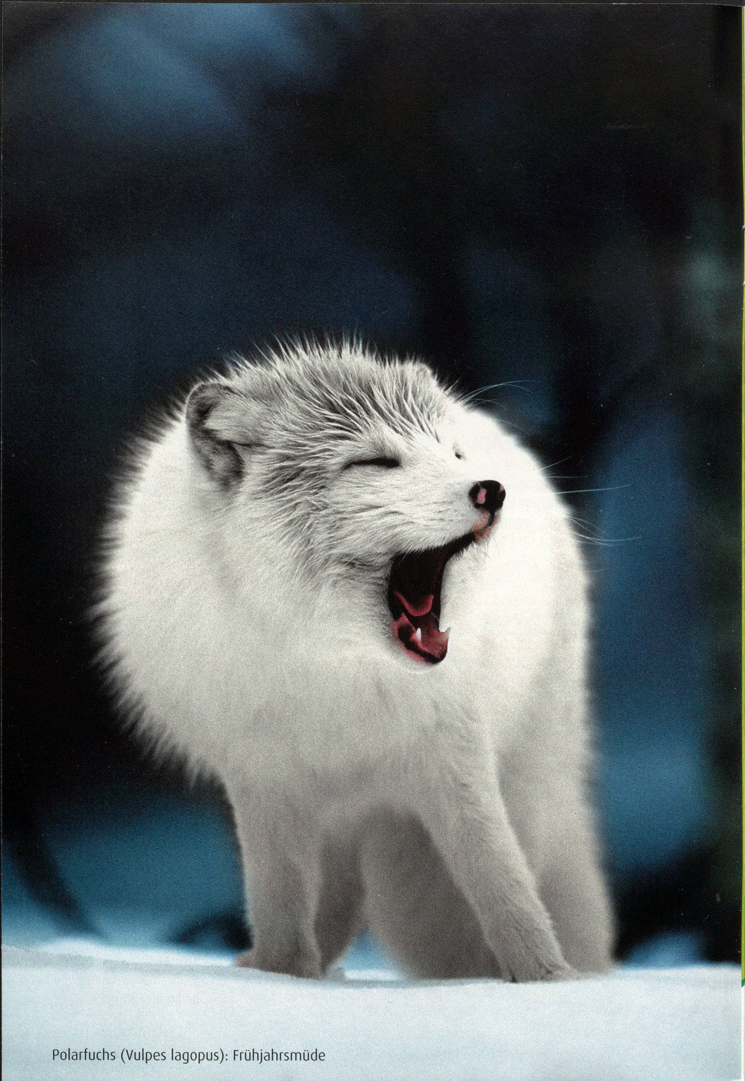
Polarfuchs ( Vulpes lagopus ): Frühjahrsmüde