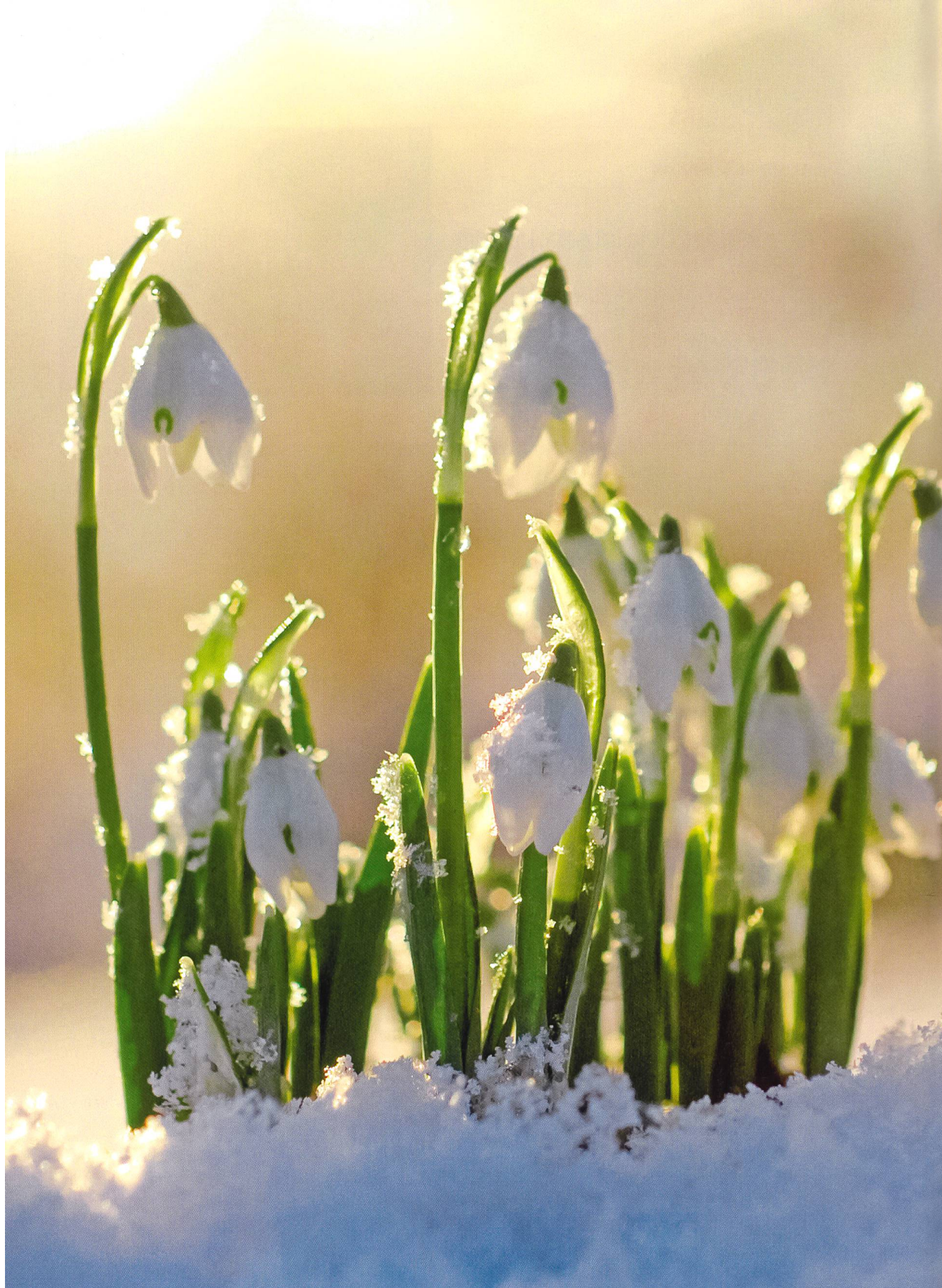
Gefährliche Schönheiten: Das Schneeglöckchen ( Galanthus nivalis ). Alle Pflanzenteile, besonders die Zwiebel, enthalten giftige Alkaloide.