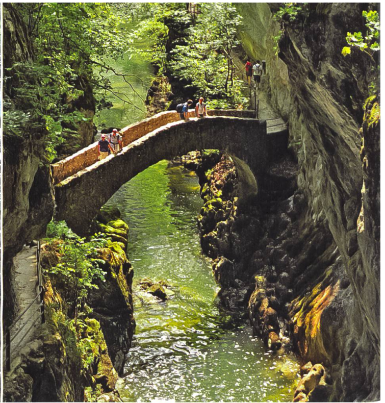
Die Areuse entspringt einer Karstquelle im Talkessel von Saint-Sulpice. Rechts die beeindruckende Bogenbrücke «Saut de Brot».

Sie steht vor ihrem Häuschen im Garten, in dem Radieschen, Salat und Kartoffeln wachsen. Klirrend kalt sei es hier im Winter, erzählt sie. Kein Mensch verirre sich dann hierher. Die Schlucht sehe aus wie ein Eispalast voller Stalakmiten und Stalaktiten.