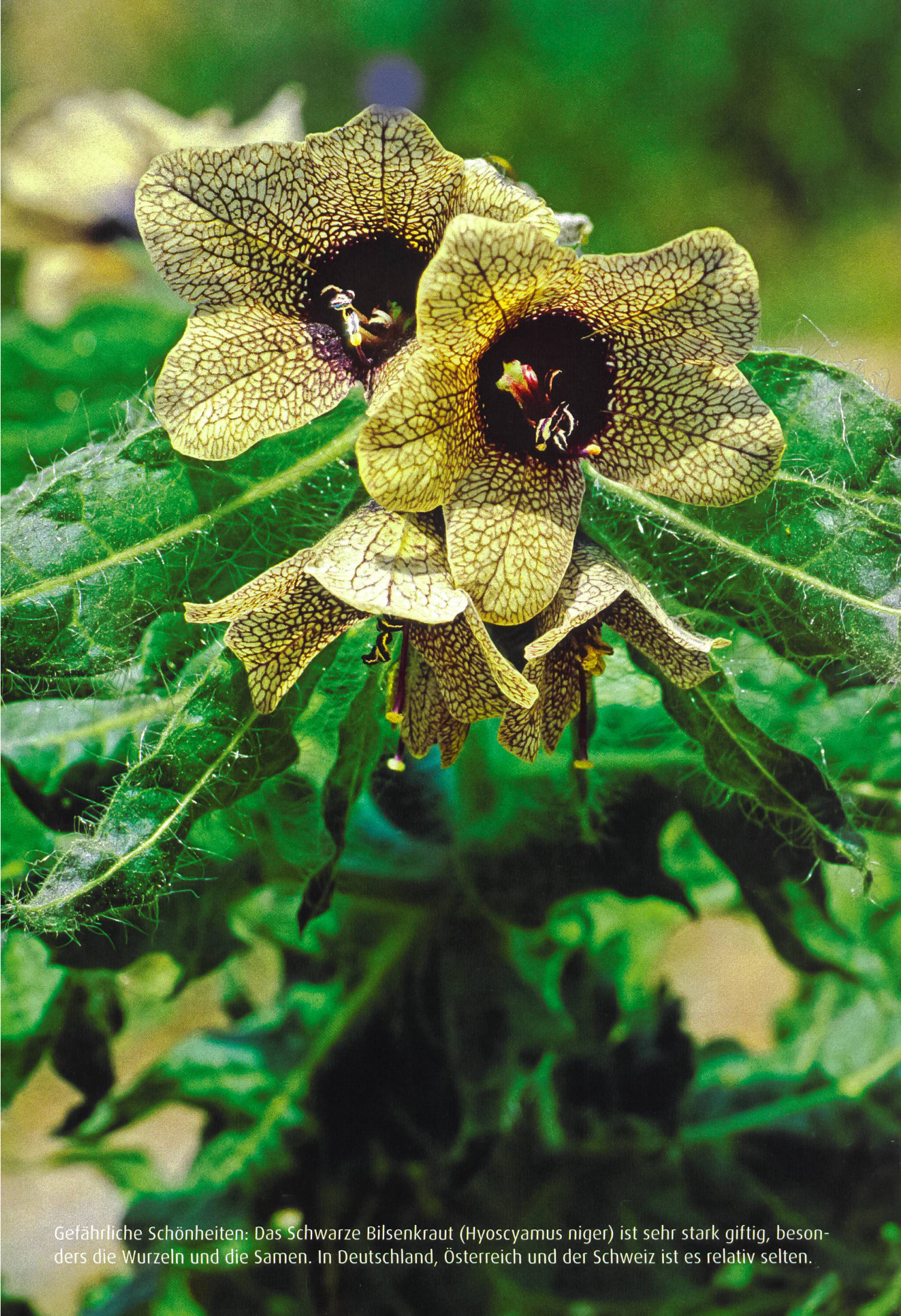
Gefährliche Schönheiten: Das Schwarze Bilsenkraut ( Hyoscyamus niger ) ist sehr stark giftig, besonders die Wurzeln und die Samen. In Deutschland, Österreich und der Schweiz ist es relativ selten.