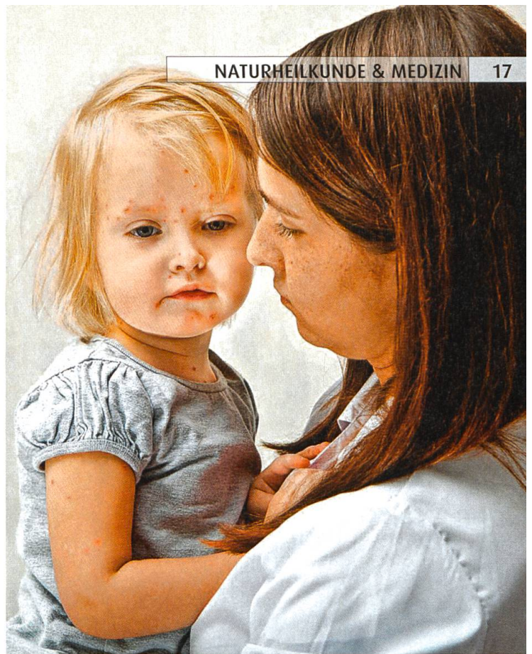
Eine Windpockeninfektion im Kindesalter ist meist harmlos. Bei Erwachsenen können jedoch Komplikationen auftreten.

bildeten und erfahrenen Anwender anvertrauen. Nur eine kompetente Fachperson kann mögliche Komplikationen rechtzeitig erkennen und verhindern.