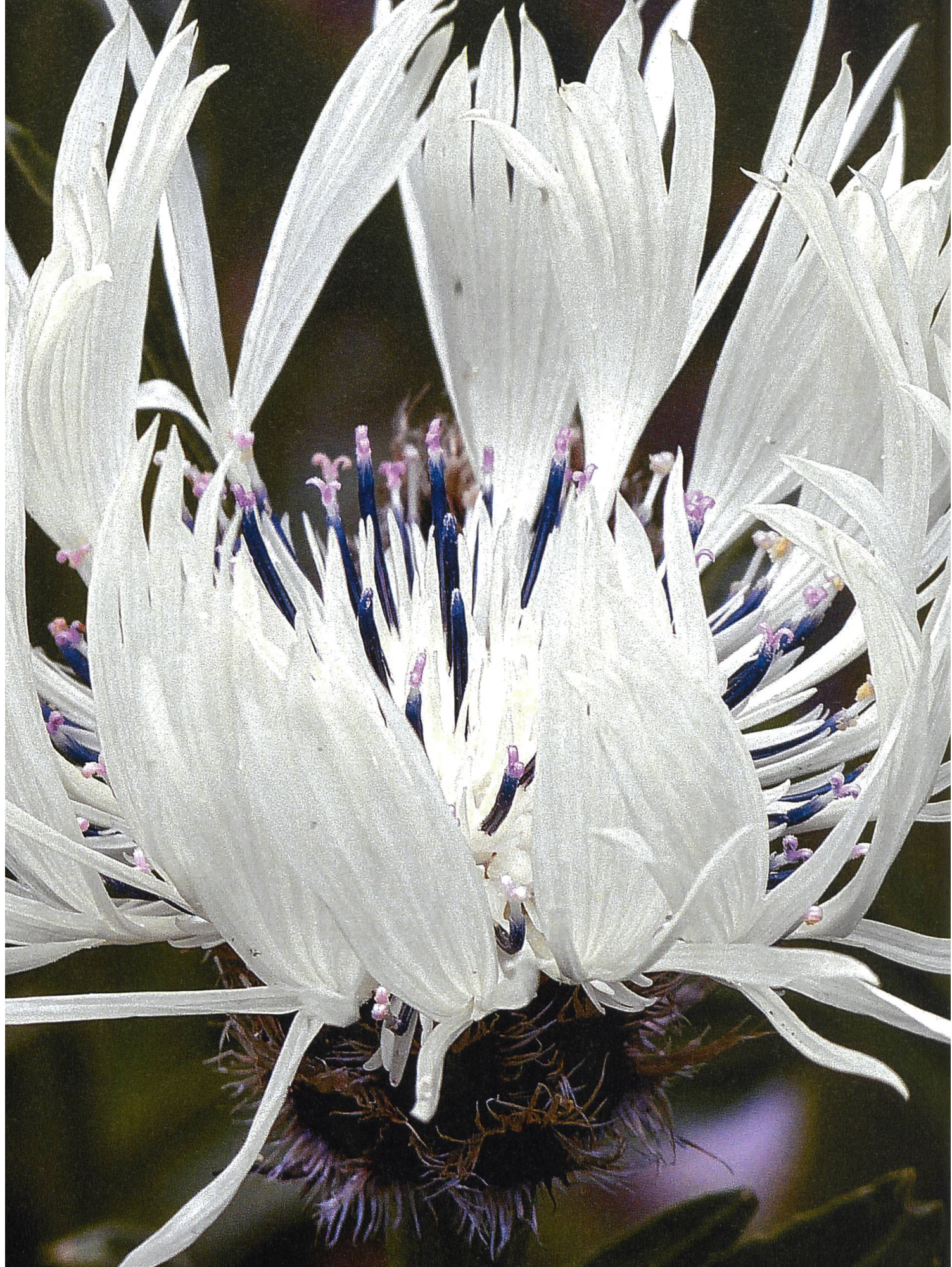
Exotische Verwandte: Die Goldlackblättrige Flockenblume ( Centaurea cheiranthifolia ) ist eine Schwesterart unserer Berg-Flockenblume ( Centaurea montana ), wächst aber im Kaukasus und Nord-Iran.