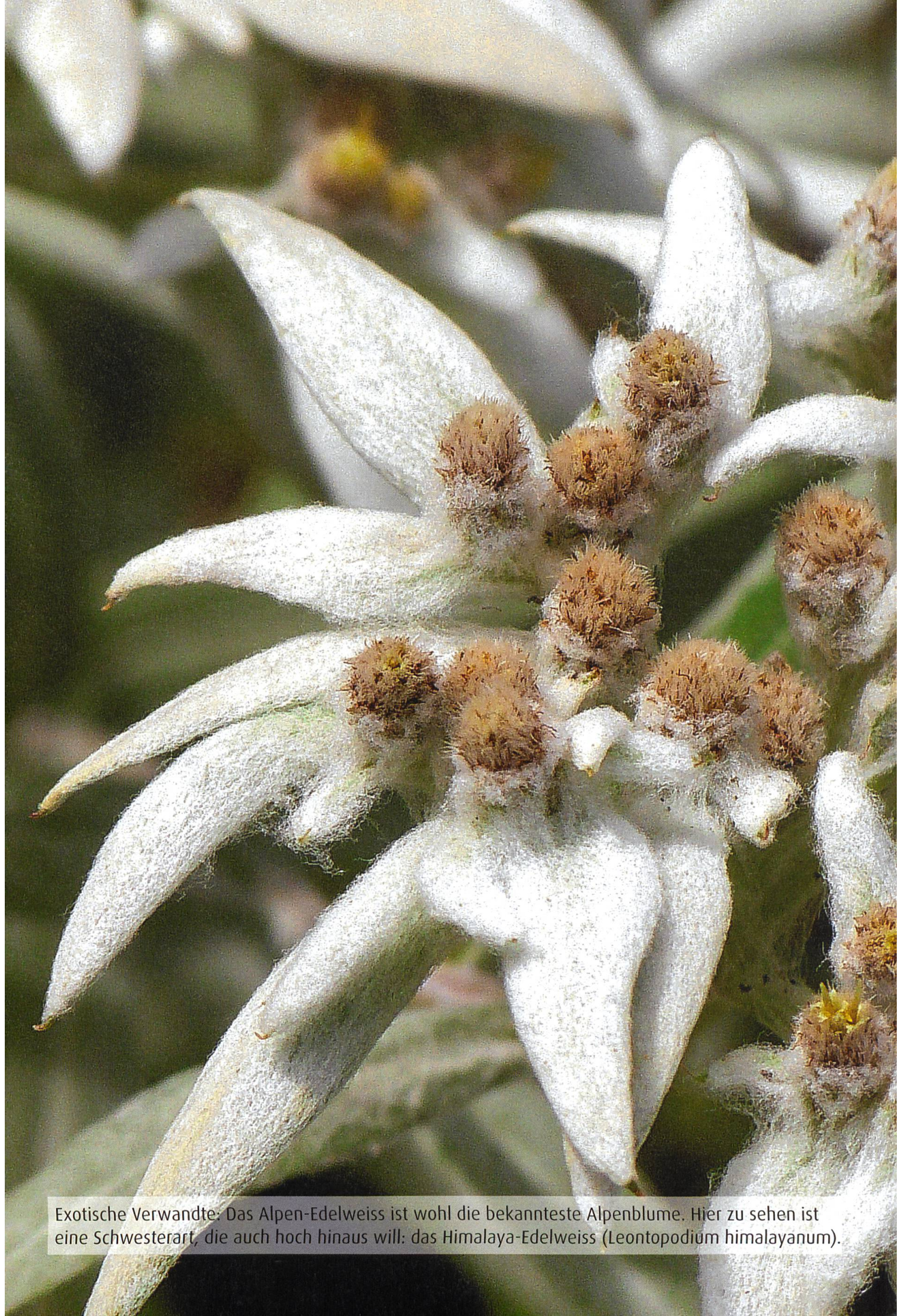
Exotische Verwandte: Das Alpen-Edelweiss ist wohl die bekannteste Alpenblume. Hier zu sehen ist eine Schwesterart, die auch hoch hinaus will: das Himalaya-Edelweiss ( Leontopodium himalayanum ).