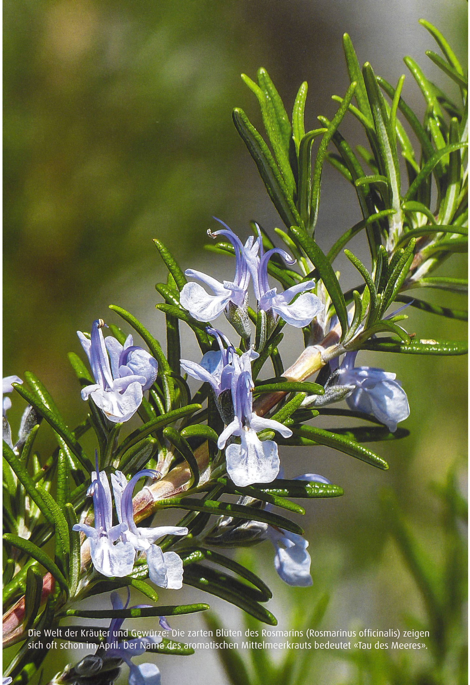
Die Welt der Kräuter und Gewürze: Die zarten Blüten des Rosmarins ( Rosmarinus officinalis ) zeigen sich oft schon im April. Der Name des aromatischen Mittelmeerkrauts bedeutet «Tau des Meeres».