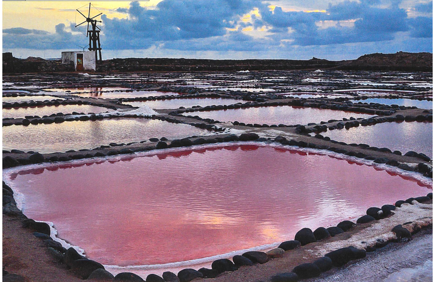
Blick in einen «Salzgarten» auf Teneriffa: Das Meerwasser verdunstet in der Sonne, in den Becken bleibt Salz zurück.

Klerus, Verträge wurden ausgehandelt. Pfade, Wege, Strassen, alles stand zu Zeiten der Kleinstaaterei unter irgend jemandes Machtbereich, verlangte Genehmigungen, Zoll, Gebühren.