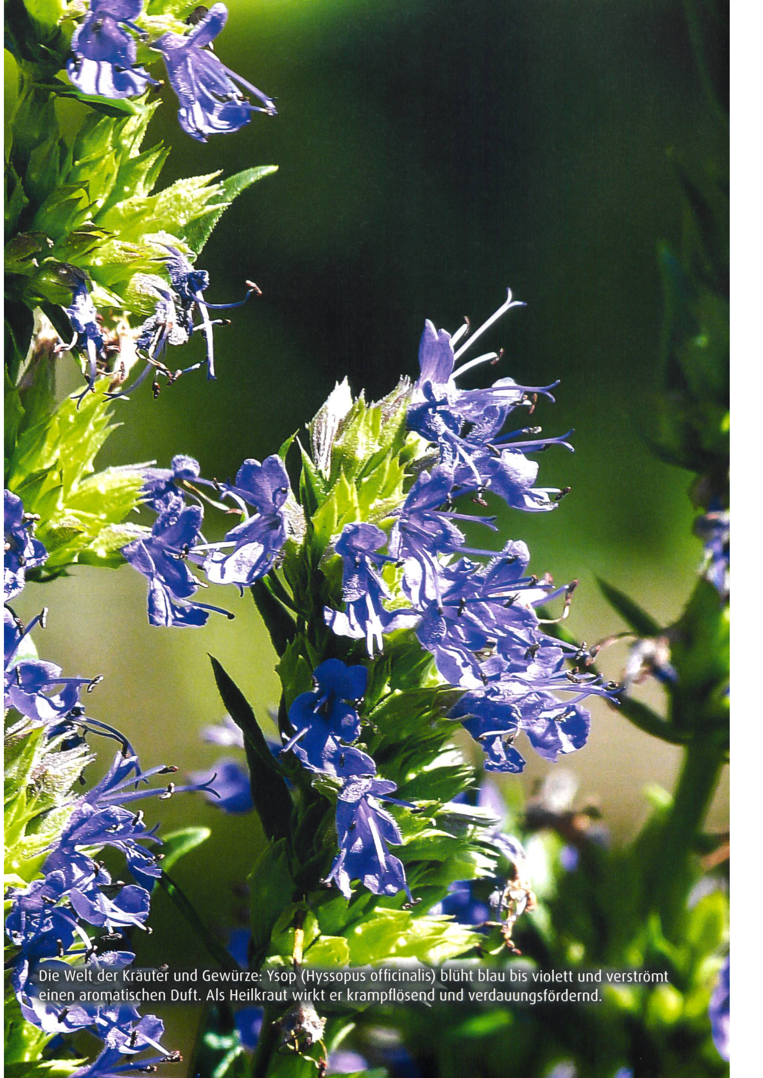
Die Welt der Kräuter und Gewürze: Ysop ( Hyssopus officinalis ) blüht blau bis violett und verströmt einen aromatischen Duft. Als Heilkraut wirkt er krampflösend und verdauungsfördernd.