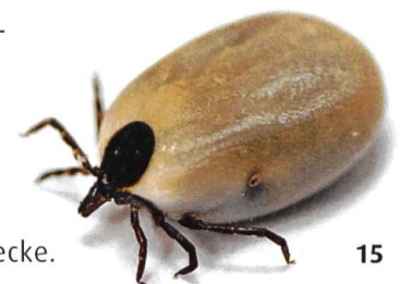
Mit Blut vollgesaugte Zecke.

Demgegenüber reduzieren andere Tiere offenbar das Infektionsrisiko: An der Berliner Charité fanden Wissenschaftler 2011 heraus, dass auf Weiden mit Kühen, Schafen oder Ziegen weniger Zecken leben als auf unbeweideten Flächen. Die fehlende Krautschicht vertreibt die Mäuse; Zecken fänden weniger Schatten und bodennahe Feuchtigkeit, die sie brauchen – und weniger Mäuse, an denen sie sich anstecken können. Doch dies ist nicht der einzige Grund für ein geringeres Infektionsrisiko auf extensiven Weideflächen. Mehreren