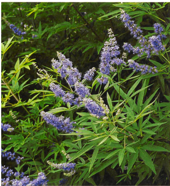
Auch die ätherischen Öle des Mönchspfeffers vergraulen offenbar Zecken.