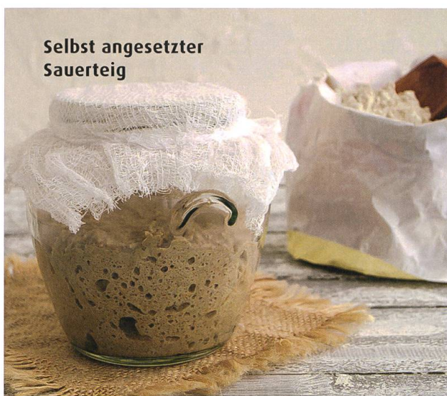
Selbst angesetzter Sauerteig

Sauerteige gelten somit nicht nur als aromatisch und haltbar, sondern auch als besonders bekömmlich. Der gesundheitliche Wert von Sauerteigprodukten war unter anderem Thema beim ersten internationalen Sauerteigkongress 2019 in Luzern. Zu den Sprechern gehörte Bernd Kütscher, der Direktor der Bundesakademie des Deutschen Bäckerhandwerks im baden-württembergischen Weinheim, an der seit 2015 die europaweit einzige Brot-Sommelier-Ausbildung stattfindet. Kütscher berichtete über die Geschichte der Sauerteigherstellung und über neue Ernährungstrends. Dabei kam er auf einen weiteren Vorteil von traditionell hergestellten Sauerteigen zu sprechen. Aus aromatischen Gründen seien selbst gezüchtete Sauerteige unerreichbar, sagte Kütscher. Auch, weil man sich hiermit geschmacklich von anderen Anbietern unterscheiden könne: «Jede Backstube hat ihre eigene Mikroflora, insofern entstehen bei selbst hergestellten Sauerteigen Brote mit eigener Identität.»