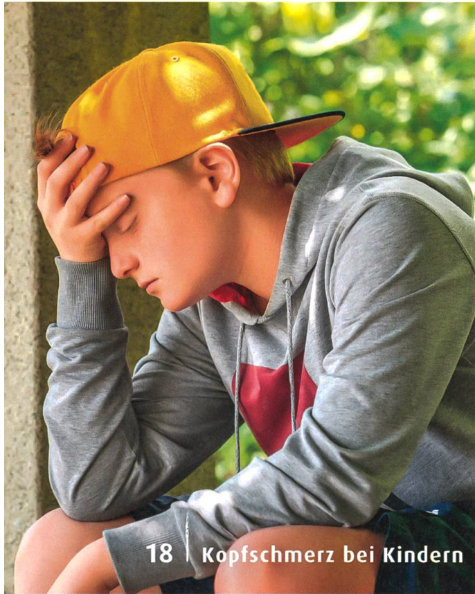
18 | Kopfschmerz bei Kindern