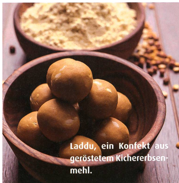
Laddu, ein Konfekt aus geröstetem Kichererbsenmehl.

Hühner- und Rindfleisch 27 g bzw. 26 g. Der empfohlene Tagesbedarf richtet sich nach dem individuellen Gewicht. Die Schweizerische Gesellschaft für Ernährung (SGE) empfiehlt generell einen täglichen Verzehr von 0,8 g Eiweiss pro Kilogramm Körpergewicht für Erwachsene; für Personen ab 65 Jahren sogar bis zu 1,0 g pro Kilogramm Körpergewicht. Demnach benötigt eine 70 kg schwere, erwachsene Person 56 g Eiweiss pro Tag. Der persönliche Tagesbedarf ist aber nicht nur vom Körpergewicht abhängig, sondern auch vom persönlichen Lebensstil – anstrengende Arbeit, viel Bewegung und vermehrte Sportaktivitäten erhöhen den Bedarf.