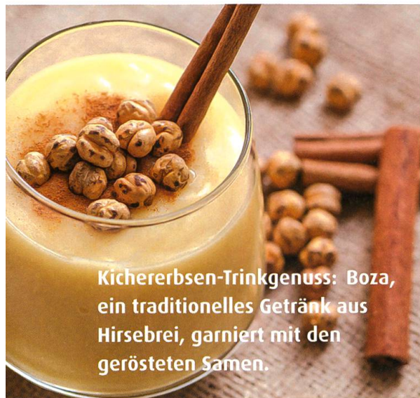
Kichererbsen-Trinkgenuss: Boza, ein traditionelles Getränk aus Hirsebrei, garniert mit den gerösteten Samen.