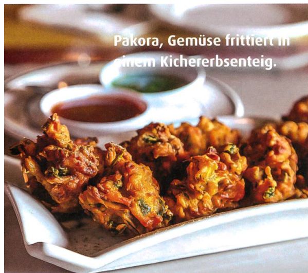
Pakora, Gemüse frittiert in einem Kichererbsenteig.