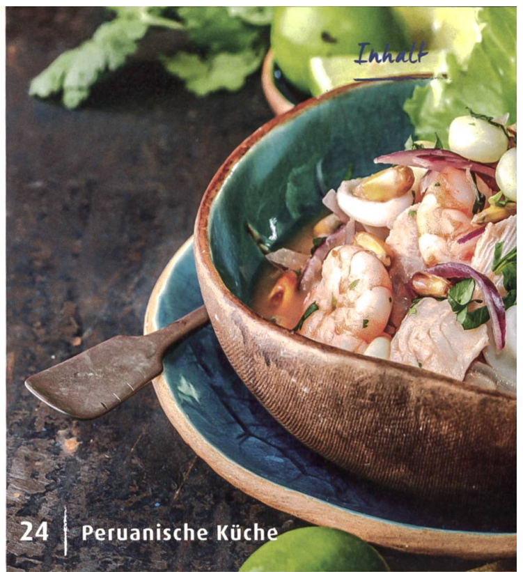
24 | Peruanische Küche