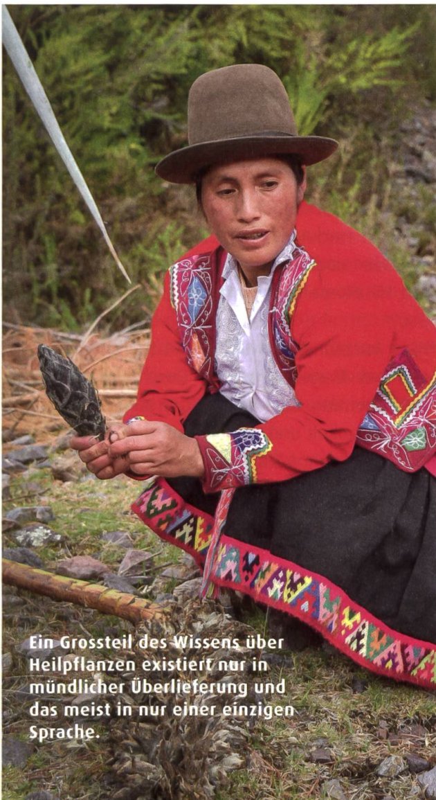
Ein Grossteil des Wissens über Heilpflanzen existiert nur in mündlicher Überlieferung und das meist in nur einer einzigen Sprache.

Immerhin sind laut der Studie weniger als 5 Prozent der untersuchten Heilpflanzenarten selbst unmittelbar gefährdet.