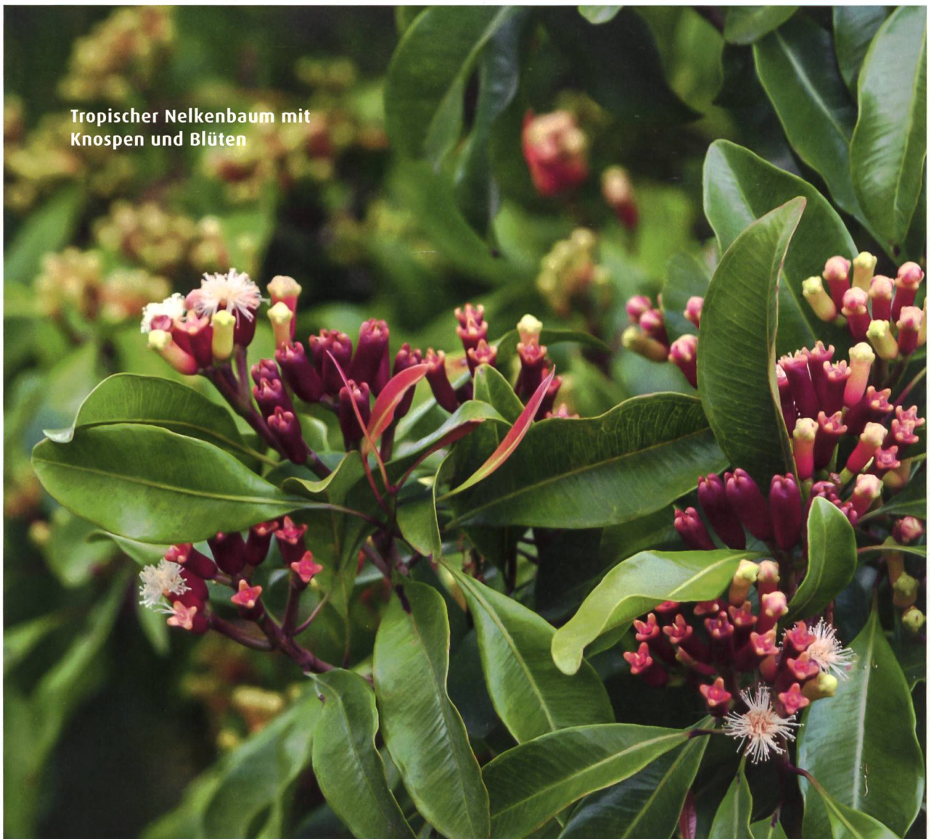
Tropischer Nelkenbaum mit Knospen und Blüten