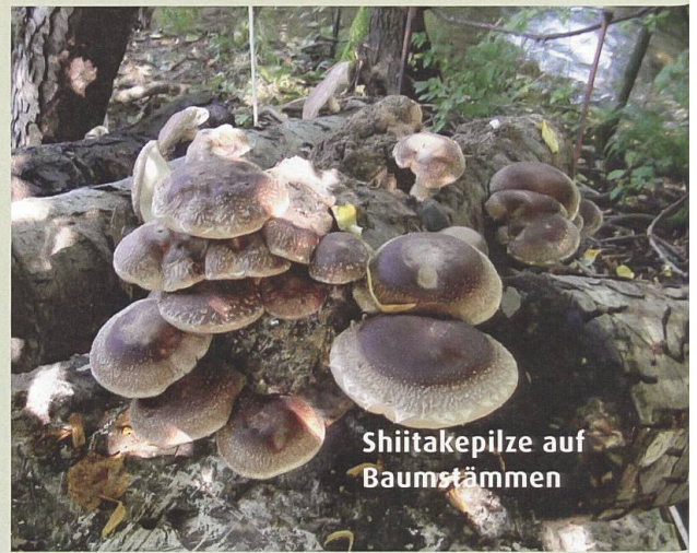
Shiitakepilze auf Baumstämmen