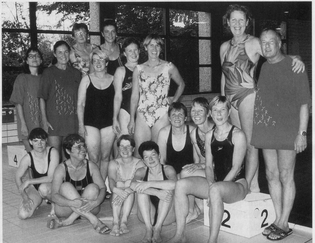
Teilnehmerinnen mit dem Kursleitungsteam (im A+S-T-Shirt).

Der Kurs dauerte acht-einhalb Tage und befähigt die Teilnehmenden, eine Wassergymnastik- oder Schwimmgruppe selbständig zu führen. Der sportfachspezifische Teil der Ausbildung umfasst Themen wie persönliche Schwimmfertigkeit, Lektionsaufbau, Wassergewöhnung, Wassergymnastik, Wasserspiele, Didaktik, Musik, Einsatz von Geräten. Damit die Leiterinnen mit Freude und gezielt unterrichten bzw. Gruppen leiten können, sollen neben der Fachkompetenz auch die didaktisch-methodische, die soziale und organisatorische Kompetenz aufgebaut bzw. gefördert werden. Beim Leiten einer Gruppe können Konflikte auftreten, zwischen der Leiterin und der Gruppe oder innerhalb der Gruppe. In der «Sozialen Schulung» setzten sich die Teilneh-