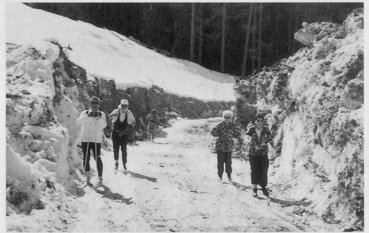
Die Gomser Loipe führte durch meterhohe Schneemauern und Lawinenkegel.