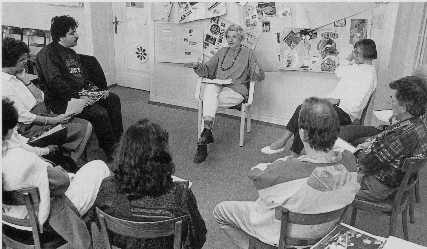
Pro Senectute Kanton Zürich bietet eine breite Palette an Aus- und Weiterbildungskursen an.