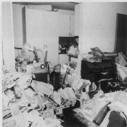
Unvorstellbare Verwahrlosung in sämtlichen Räumen.