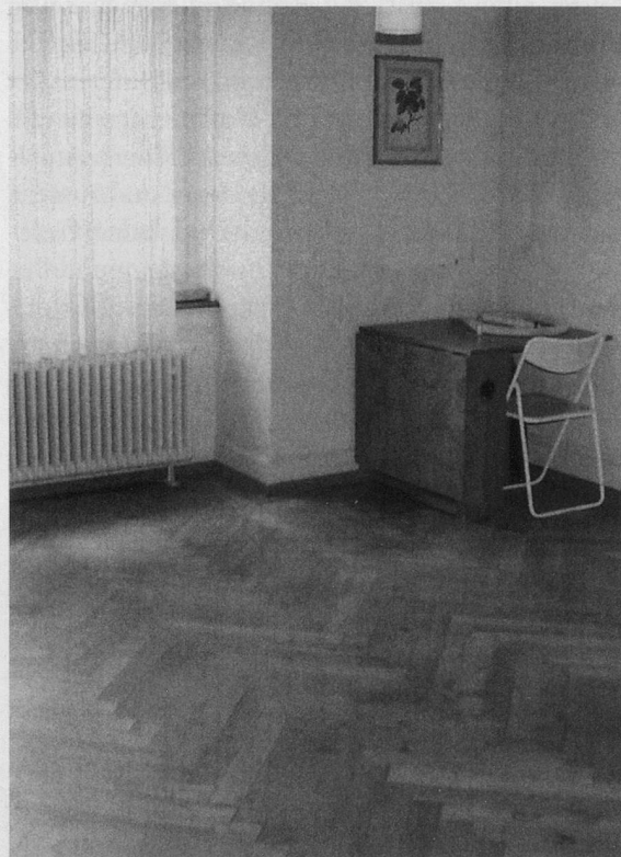
Das Parkett kommt wieder zur Geltung. Eine Glanzleistung der Reinigungsequipe.