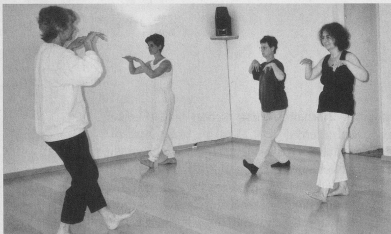
Qi Gong: Mit sanften Bewegungen zu mehr Energie und Beweglichkeit.

Qi Gong ist eine Möglichkeit, zurückzufinden zu dieser natürlichen Leichtigkeit, zu freieren Bewegungen und einem Gefühl von Harmonie. Die Chinesen befassen sich schon seit Jahrtausenden mit Gesundheits- und Langlebigkeitstechniken. Sie praktizieren diese Übungen auch heute noch als Teil ihrer täglichen Routine. Die lange Tradition hat gezeigt, dass sich Qi Gong gerade auch bei älteren Menschen sehr bewährt. Die Übungen dienen der Aktivierung der Lebensenergie sowie der Erhaltung und Förderung der Gesundheit. Sie sind leicht zu erlernen, unabhängig von Alter oder Gelenkigkeit, und umfassen Körperhaltung, Bewegung, Atem-