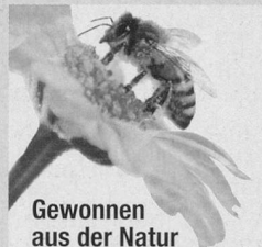
Gewonnen aus der Natur

Nach dem Schlüpfen produzieren Bienen nur kurze Zeit aus ihren Kopfdrüsen Weiselfuttersaft – auch Gelée Royale genannt. Dieses spezielle Futter ist ausschliesslich nur für die Bienenkönigin allein bestimmt. Durch dieses Energie-Futter wird sie deshalb 5mal so alt und doppelt so gross wie die normalen Bienen und hat so die Kraft um täglich bis zu 2000 Eier zu legen.