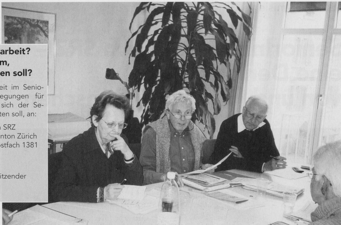
Politisches und gesellschaftliches Leben des SRZ: Den Dialog zwischen Generationen, Kulturen und Behörden fördern.