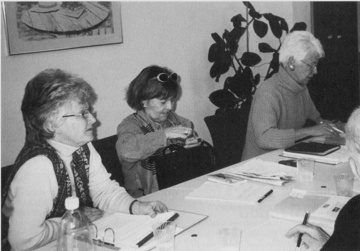
Der SeniorInnenrat Zürich SRZ: vertritt die Anliegen der älteren Bevölkerung in der Öffentlichkeit.

Kein Zweifel: Unter den selbstorganisierten Seniorengruppen von Pro Senectute Zürich nimmt der SeniorInnenrat Zürich eine bedeutungsvolle Stellung ein, handelt es sich doch um eine eigentliche Denkzentrale. Ziel des SeniorInnenrates ist es, die Anliegen der älteren Bevölkerung des Kantons und der Stadt Zürich in der Öffentlichkeit zu vertreten. Themen dafür gibt es unzählige, schliesslich sind Senior/innen in allen Lebensbereichen präsent.