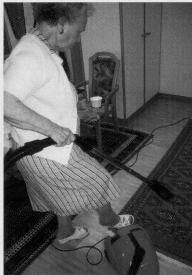
Selbständig in der eigenen Wohnung, dank angepasster Wohnform.

Auskünfte zur Pro Senectute-Wohnberatung/Wohnungsanpassung: Telefon 01 421 51 34.